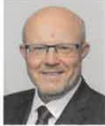
prof. MUDr. Vlastimil Válek, CSc., MBA, EBIR