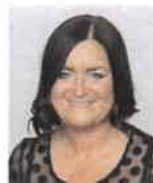
Mgr. Helena Langšádlová