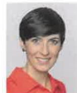
Ing. Markéta Pekarová Adamová