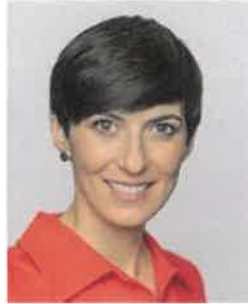
Markéta Pekarová Adamová

Místopředsedkyně a místopředsedové Poslanecké sněmovny