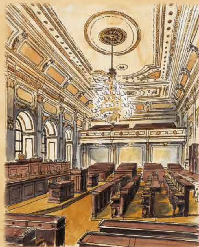
La grande salle du palais Thun – la salle des séances plénières de la Chambre des Députés d'aujourd'hui

En vertu de son mandat, la Constitution assure la soustraction du membre du Parlement de la République tchèque au régime général des sanctions en lui accordant des immunités. L'objectif en est d'assurer l'indépendance totale du corps législatif dans le processus décisionnaire. La première est que le Député ne peut pas être poursuivi pour son vote ou pour ses déclarations réalisées à la Chambre des Députés ou au Sénat. Pour ces déclarations, le Député n'est soumis qu'à la compétence disciplinaire de sa chambre. La deuxième forme d'immunité est la soustraction aux poursuites pénales. Le Député ne peut être poursuivi pénalement sans l'accord de la chambre. Si la chambre refuse de donner son accord, la poursuite pénale pour l'acte en question, pendant le temps de son mandat, est exclue.